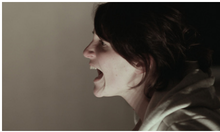
Mersa Alam